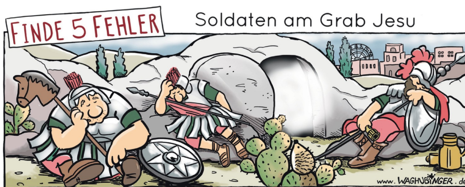
Steckenpferd, Igel, Riesensrad, Taschenlampe, Thermoskanne

mit hundert neuen Samenkörnern. Jesus vergleicht sich selbst mit einem Weizenkorn. Er ist tot, wird ins Grab gelegt. Doch am Ostermorgen lebt er wieder durch Gottes Wirken – neues Leben keimt auf, wie der kleine grüne Halm, der aus der Erde herausguckt. Aber Jesus lebt nicht nur, er bringt auch Frucht. Die Nachricht, dass er den Tod überwunden hat und seine Botschaft von Gottes Liebe zu allen Menschen wird weitergesagt, überall auf der Welt werden Gemeinden gegründet: Zuerst dort, wo Jesus gelebt hat, dann in Afrika, dann in Europa – und irgendwann dann auch hier bei uns. Auch wenn es sich komisch anhört, kann man es so sagen: Wir alle sind die Früchte von Jesus. Wir sind Samenkörner Jesu Christi. Gewachsen, weil er auferstanden ist.