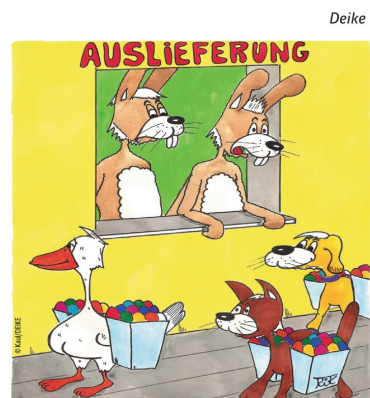
„Das sind also die Oster-Aushilfskräfte, die du so billig engagieren konntest!“

Bitte beachten Sie daher den Kirchenanzeiger bzw. die Aushänge zu gegebener Zeit.